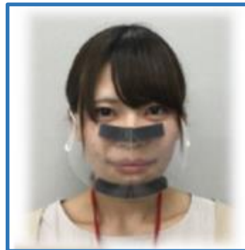
完成品と着用した様子