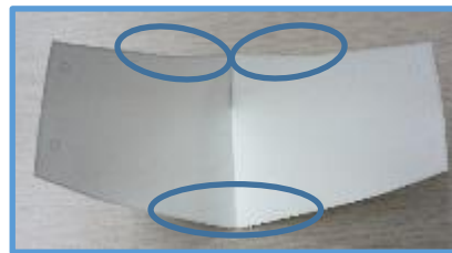
手順2. ○部分にテープを貼る